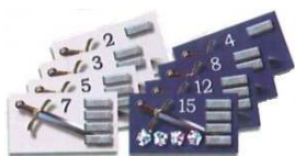
19 tuiles d'épées