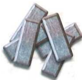
23 tuiles de métal