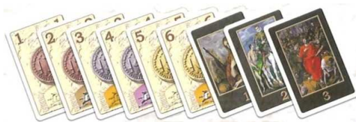
90 cartes de jeu (84 cartes d'argent et 6 peintures du Greco)