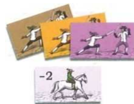
16 tuiles maître d'arme (12 duels et 4 déplacements)