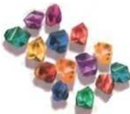
20 pierres précieuses